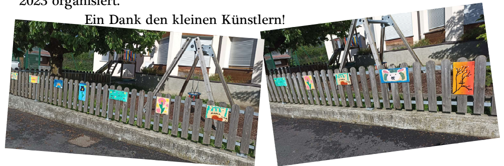
Ein Dank den kleinen Künstlern!

Bibliothek: Die Sommerleseaktion wartet auf Interessierte! Holt euch eine Karte in der Bibliothek und notiert euch die gelesenen Bücher( min.4). Wir werden die Teilnehmer bei einem Spielenachmittag Ende Oktober besonders hervorheben. Am Freitag, 9.06.2023 um 16:30 Uhr ist „Vorlesen/Vorspielen für die Kleinen“