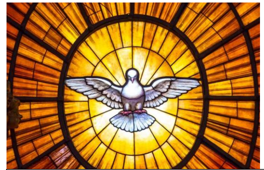
Darstellung des Hl. Geistes im Petersdom in Rom

Der Heilige Geist wird uns an alles erinnern, was Jesus gesagt hat und vor allem was seine Aufgabe war und ist. Er möchte eine Herde , weil nur ein Hirte ist. In vielen Bildern hat er uns an diesen Wunsch erinnert und uns gesagt, dass wir nur Einheit erlangen, wenn wir wie er, immer den Willen des Vaters im Herzen haben und uns vom Heiligen Geist führen lassen. Bitten wir inständig um diesen Heiligen Geist , damit wir beim Abschied des Herrn, mit Dank ihm zujubeln können und sicher sein können, dass ER immer bei seiner Herde bleiben wird.