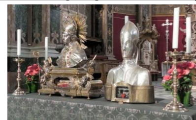
Reliquien Hl. Kassian und Hl. Vigilius