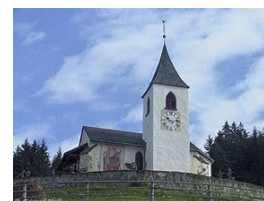
Kirche von St. Jakob in Afers