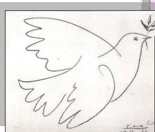
Vier Jahre nach Ende des Zweiten Weltkriegs entwarf Pablo Picasso (1881–1973) für den Weltfriedenskongress in Paris die Silhouette einer Taube. Sie wurde in den folgenden Jahren schnell zum Symbol der Friedensbewegung .