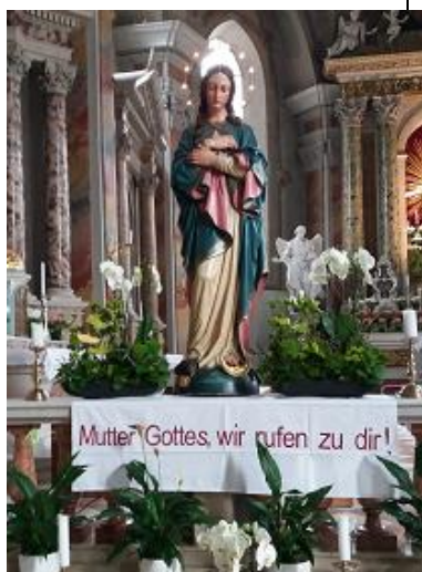
Muttergottesstatue in der Pfarrkirche

täglich um 19.15 Uhr in der Franziskanerkirche