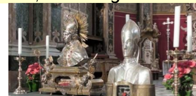
Reliquien Hl. Kassian und Hl. Vigilus

Begleitet von 12 Erstkommunionkindern werden die Reliquienbüsten, des heiligen Kassian, des heiligen Ingenuin, des heiligen Albuin, des seligen Hartmann sowie – seit 1992 – auch jene des zweiten Diözesanpatrons Vigilus mitgetragen. Ergänzt wird die Prozession durch die Reliquien dreier bedeutender Frauengestalten der Heiligenverehrung: Agnes, Ottilia und Christina.