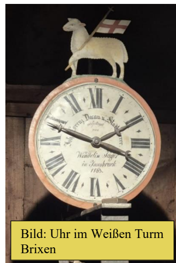
Bild: Uhr im Weißen Turm Brixen