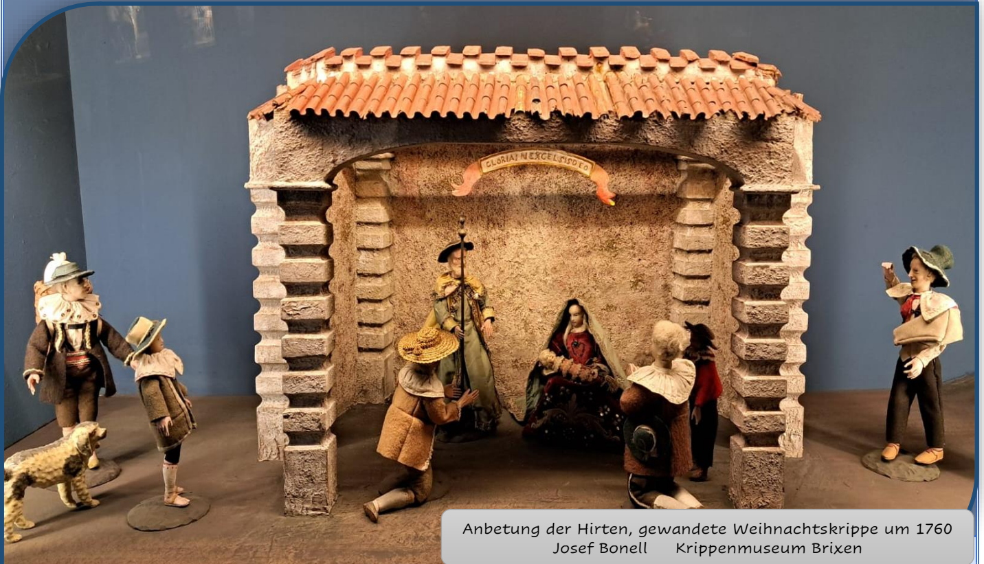
Anbetung der Hirten, gewandete Weihnachtskrippe um 1760 Josef Bonell Krippenmuseum Brixen

STILLE NACHT, HEILIGE NACHT, CHRIST, DER RETTER, IST DA!