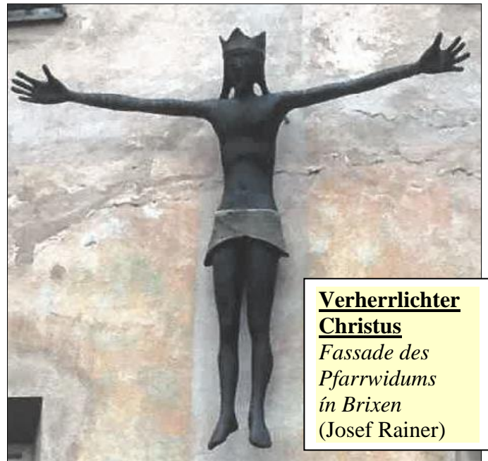
Verherrlichter Christus Fassade des Pfarrwidums in Brixen (Josef Rainer)

Die Karwoche möchte uns zeigen, worum es in unserem Leben geht. Die Passionsgeschichte nimmt Fahrt auf, die Szenerie verdichtet sich und mit ihr auch die Konsequenzen für unser Leben. Es soll klar werden: Es wird nicht nur eine jahrtausendealte Geschichte erzählt, sondern unsere eigene. Wo sind unsere Gräber? Welche Leichen haben wir im Keller? Welche Hoffnungen, Ziele, Talente haben wir lebendig begraben? Und wäre es nicht an der Zeit, sich dem eigenen Dunkel zu stellen, sich aus dem Grab helfen zu lassen und mit den Talenten neu zu wuchern? Was sind meine Talente? Und wo